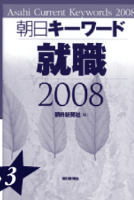
朝日キーワード就職2008

お申し込みお問合せは http://www.asahi33.com/jobnavi/ ☎0120-33-0843