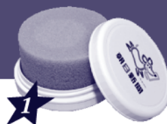
就活のお守り コンパクト靴磨き