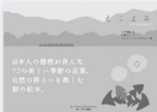
えごよみ ecyomi3 日本人の感性とともに伝えられてきた「二十四節気」、「七十二候」の様々な言葉を知り、四季の気配を感じられる暦の絵本。大塚なつ子の風景画が展開する。 絵：久村春樹 文：加藤久人 編集：Think the Earth プロジェクト 発行：プロダクション

原稿を書いている今は、つぼみが見えてきたばかりの通勤路の桜。この「Think the Earth PAPER Vol.4」が発行になる頃には、満開の花をつけているでしょうか。「さまざまのこと思ひ出す桜かな」とは芭蕉の句ですが、桜の花に自分の心象風景を重ねるのは日本人ならではの感性なのかもしれません。二十四節気、七十二候は、古代中国で作られ、日本に伝えられた農事暦です。「立春」「啓蟄」など、現代に生きる私たちにも馴染みの二十四節気。「桜始めて聞く」「蚕起て桑を食う」「虹始めて見る」……季節ごとに表情を変える植物や動物、空や大地の移るいを短くも美しい言葉で表現した七十二候。桜に限らずいろいろな自然の変化に敏感に捉え慈しむ心の豊かさを、私たち日本人がずっと大切にしてきたことがわかります。Think the Earth プロジェクトが発行する暦の絵本「えごよみ」でも、日常の中に二十四節気・七十二候を取り入れ、季節の気配を感じてみようと呼びかけてきました。春の暁動、夏の陽射し、秋の色彩、冬の味覚。いにしえの時代から現代に至るまで、変わらない四季折々の楽しみもあります。超早起きの保育園児の息子に起こされて、夜明け前に窓を開けると、「春はあけぼの」と書いた清少納言の気持ちがわかる気がして、彼女も通か昔、平安の空に深呼吸をしたのだからかと想像する今日この頃です。皆さんは、どんな春を迎えていますか? 桜のあとにも「牡丹華さく」、「紅花榮う」と賑わいで、季節は夏へと向かいます。