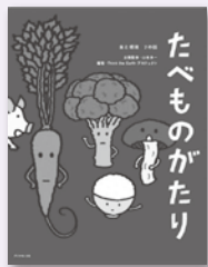
たべものがたり 食と環境7の話を生きるとは食べること。「いきものがたり」「みずものがたり」に続くビジュアル・ブック第三弾。企画監修：山本良一（東京大学教授） 編著：Think the Earth プロジェクト 発行：ダイヤモンド社 ※「ご当地食材で作った弁当」のリポートも募集中。詳しくはウェブサイトか本巻書込みリーフレットで!

父さんと兄弟に食べてもらう…… ごく自然に家族が会話する時間が増えるという。『たべものがたり』には、高宮小の卒業生に贈った言葉を書き添えていた。竹下先生の思いが凝縮された名文句だ。「弁当の日」に取り組み学校は、すでに300校を超えている。広がれ!! 弁当の日。